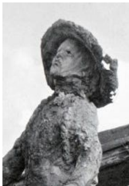
希い 傷だらけの少女 (サバニ舟の一家・部分) 彫塑 金城 実 (沖繩・読谷村)

いまこそ愛国救民の草の根市民運動よ、広がれ! 全国津々浦々に「こまべり場」を! 学び場を!